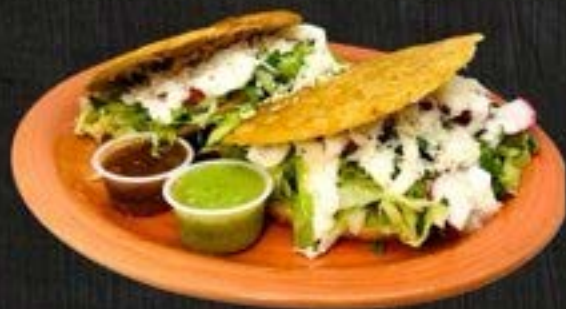
GORDITAS $7 EACH

thick corn tortilla, stuffed with cheese, meat, and veggies