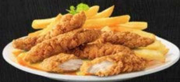
CHICKEN TENDERS $9.5