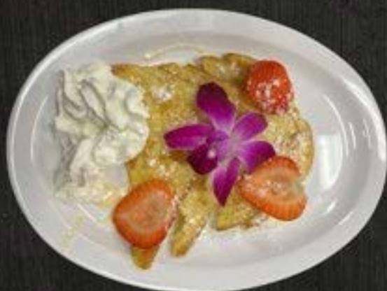
PAN FRANCES 57