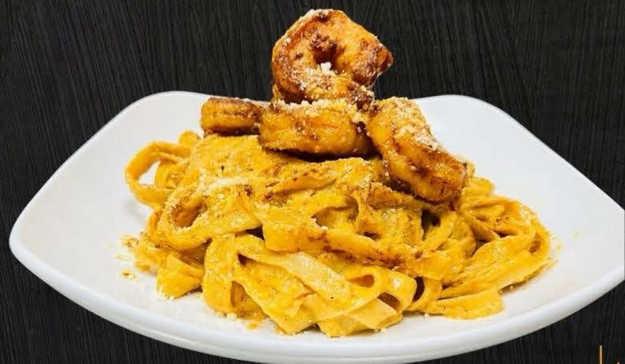
PASTA CON CAMARON $16.50