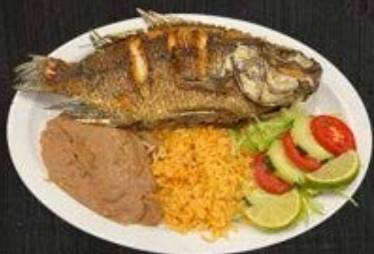
MOJARRA FRITA $19