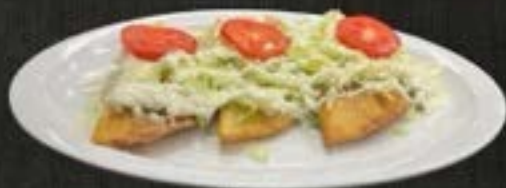
QUESADILLAS FRITAS $12 ORDER