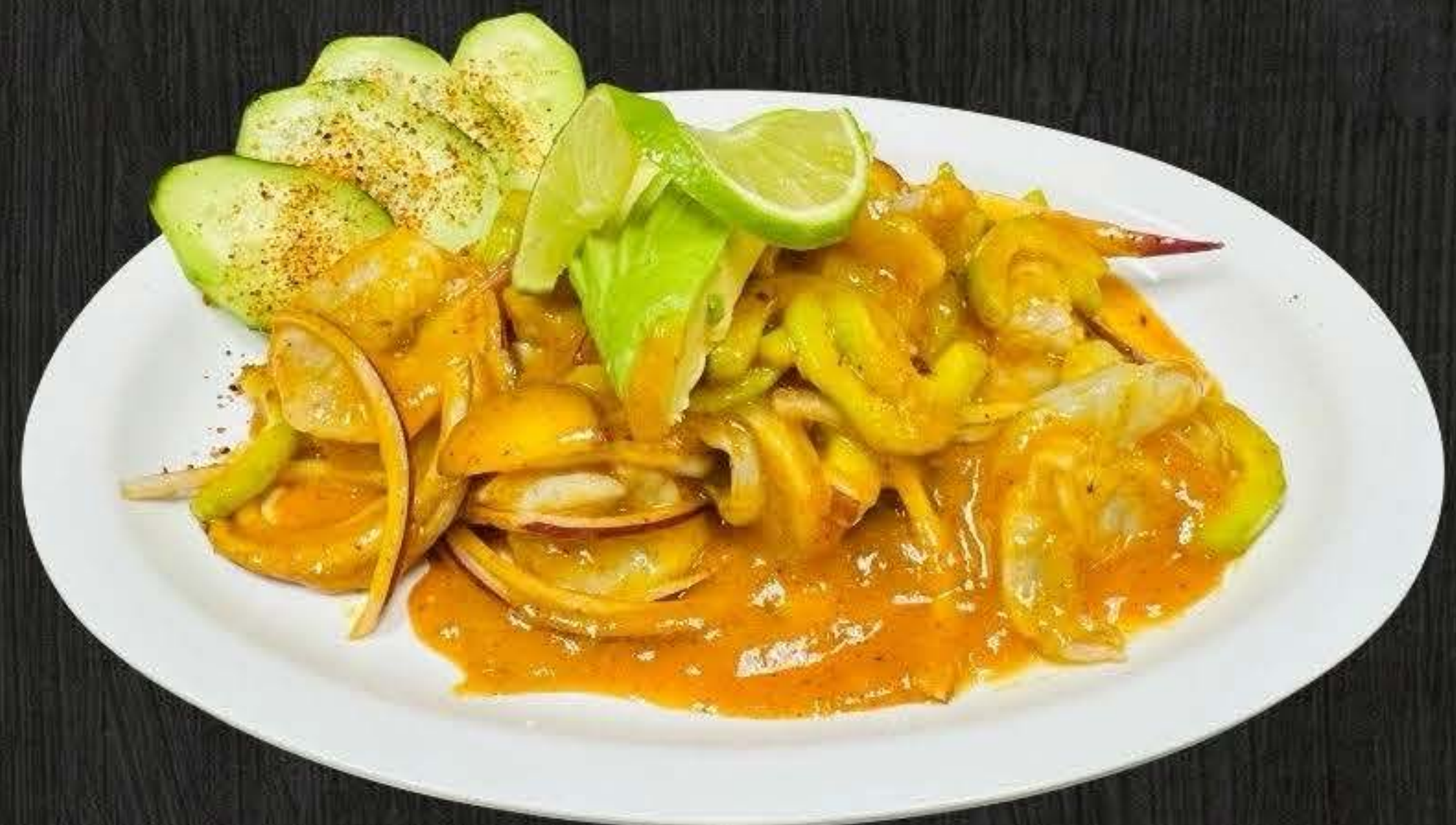
AGUACHILE MANGO $18.50