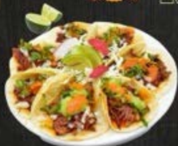
TACOS DE BIRRIA $3.50