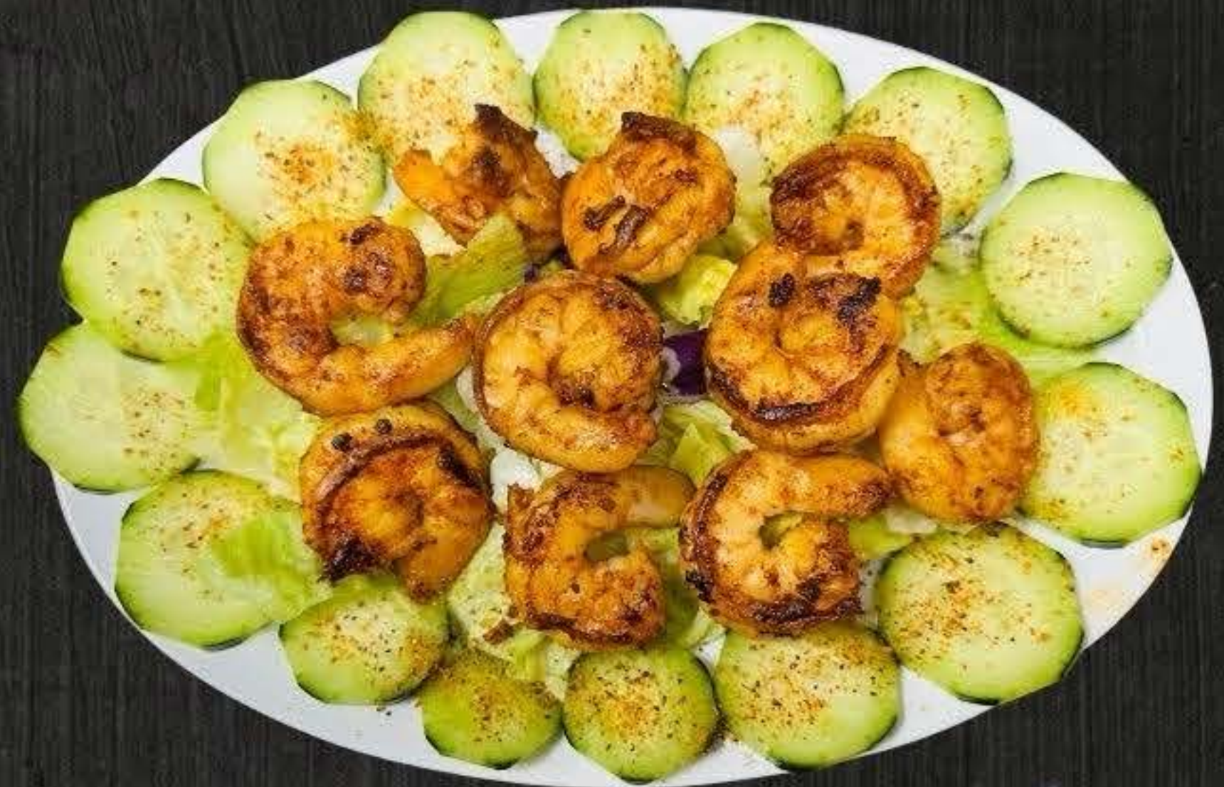
BOTANA DE CAMARON $16.50