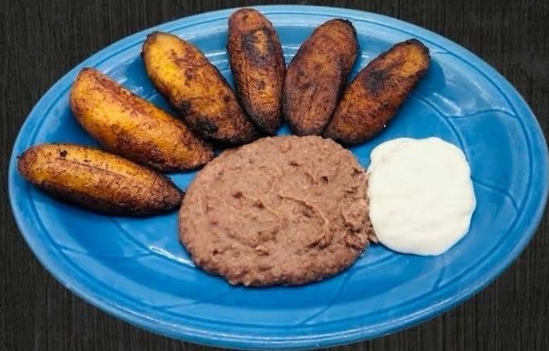
PLATANOS CON FRIJOLE Y CREMA $8