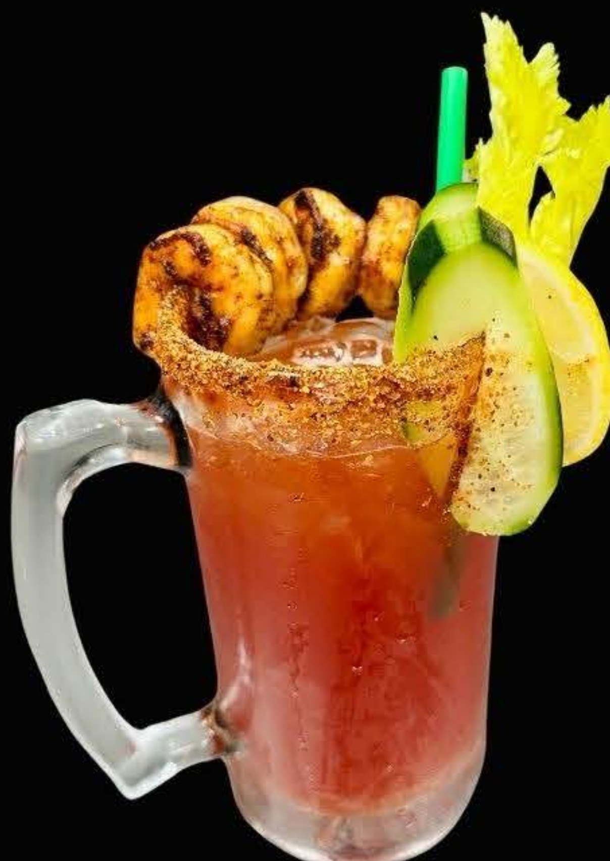
michelada con camarón $14