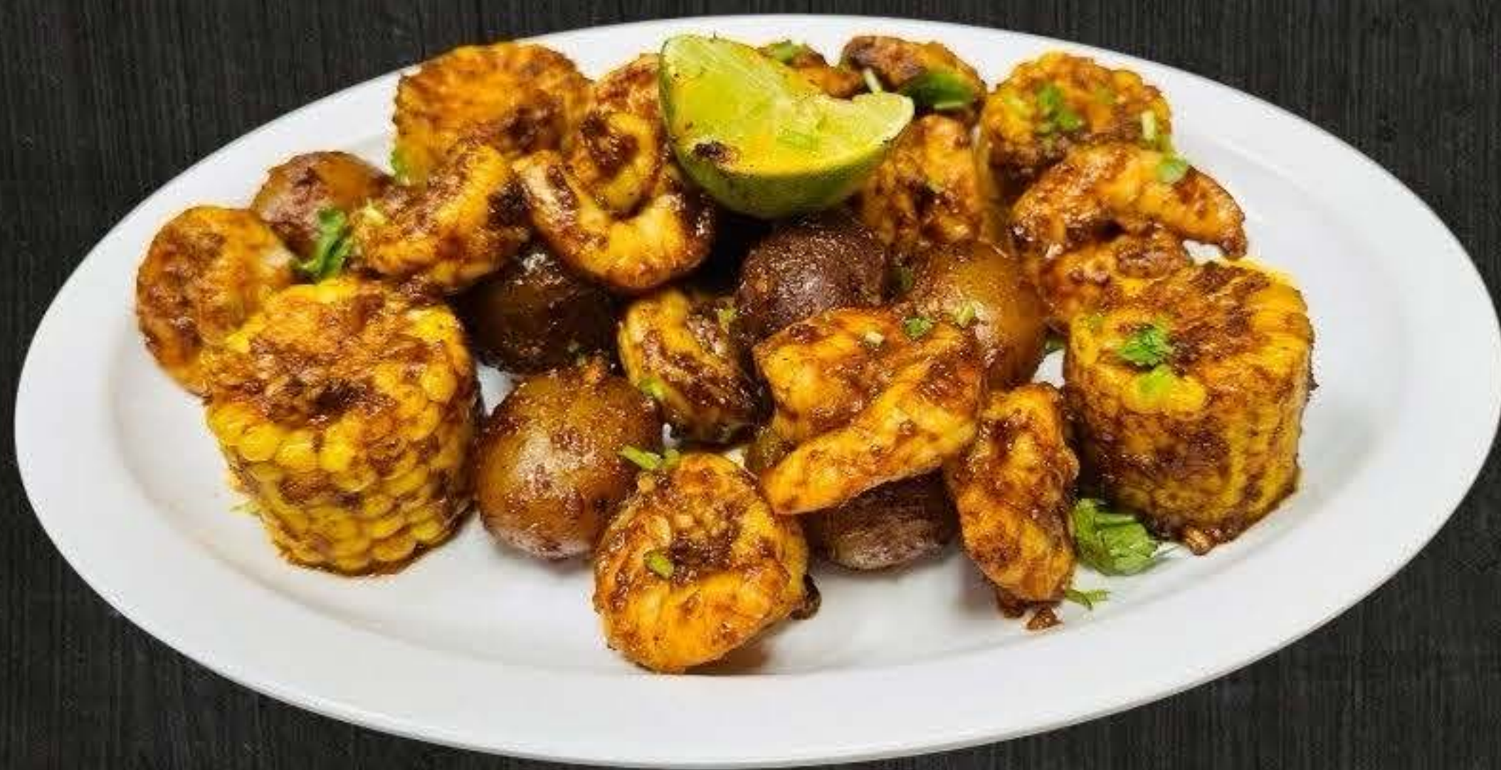
CAMARONES LOUSIANA $26