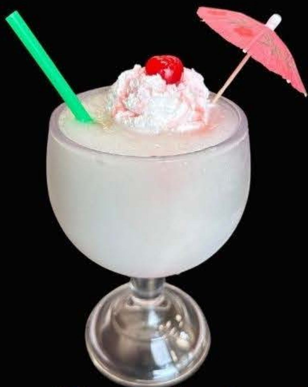
piña colada $14