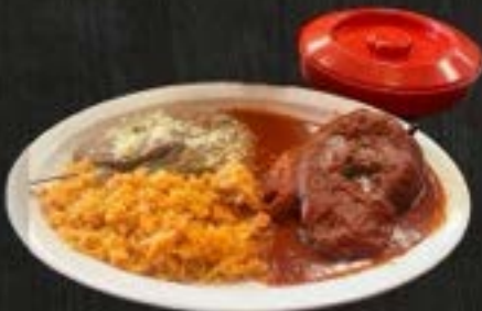
CHILE RELLENO $13.50