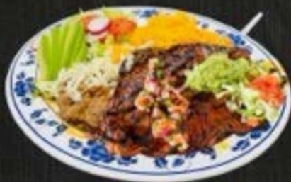
CARNE ASADA PLATE $19 grilled steak