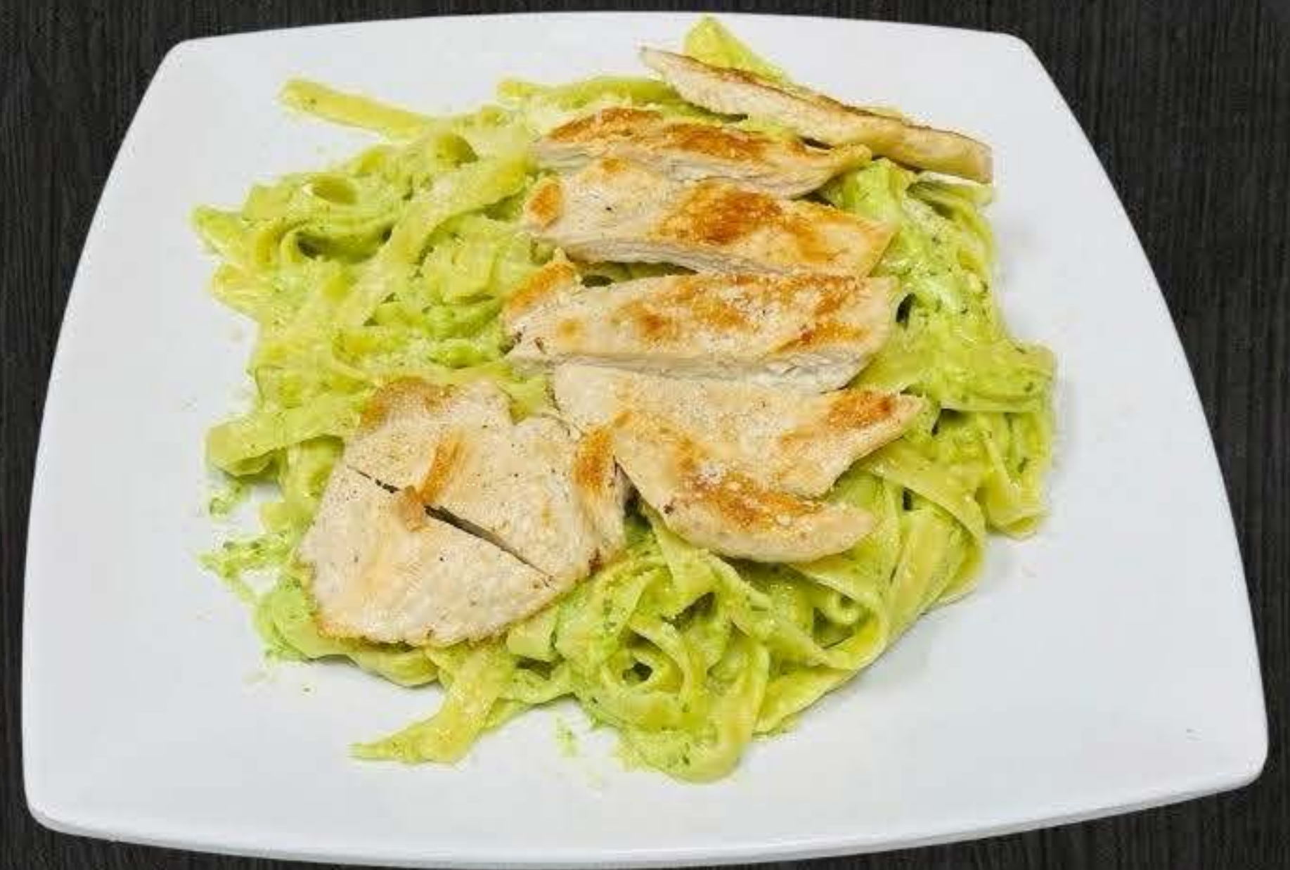
PASTA VERDE 18.50