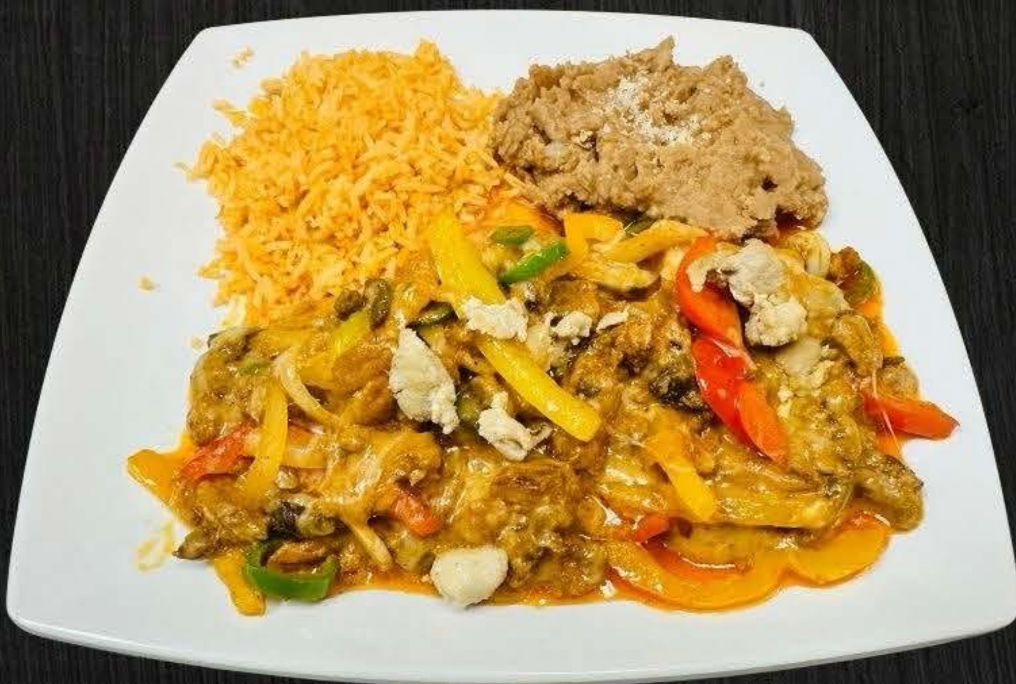
STAKE FAJITAS $19.50