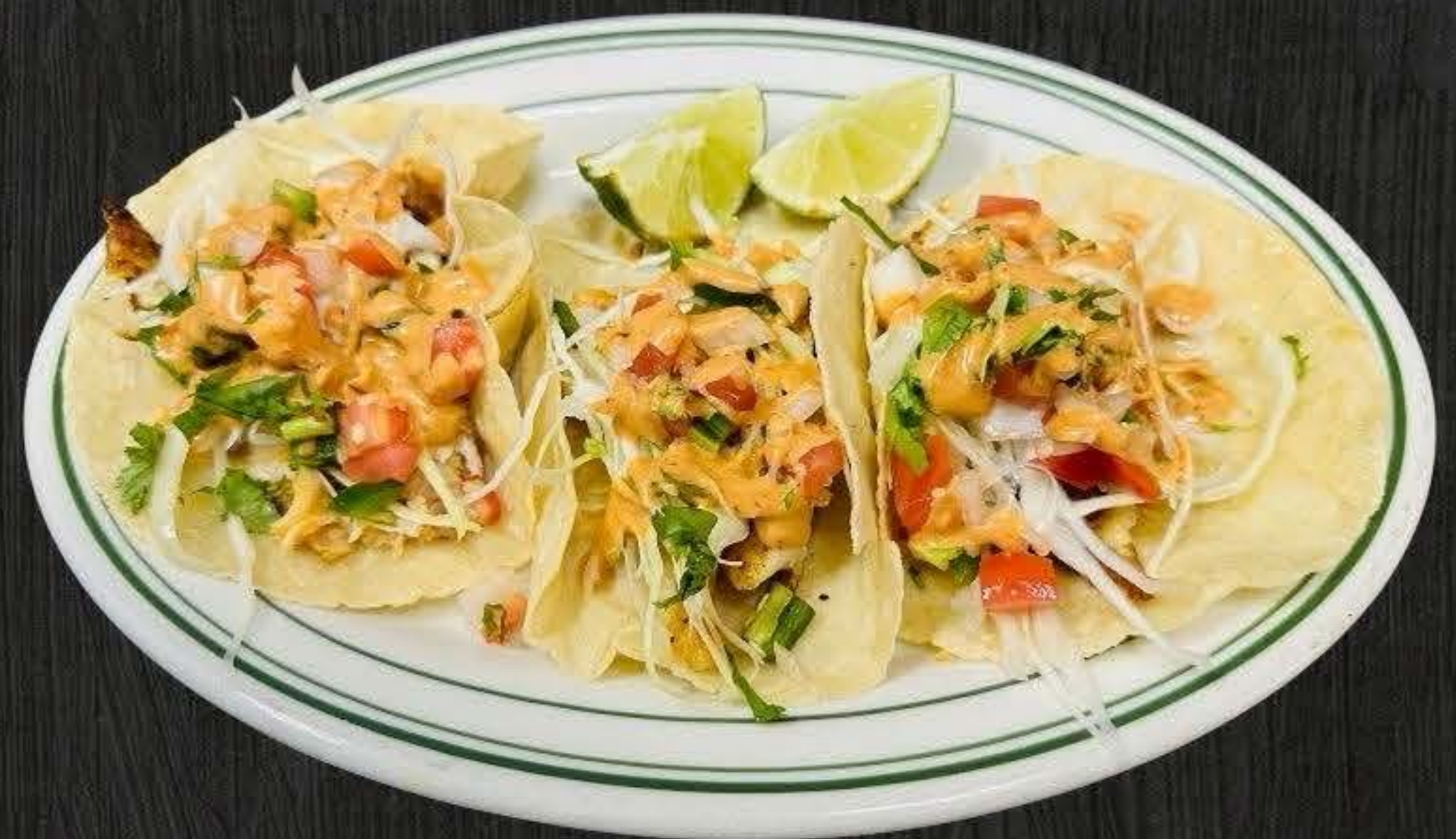
TCAOS DE PESCADO 3X$12 TACOS DE CAMARON 3X$12