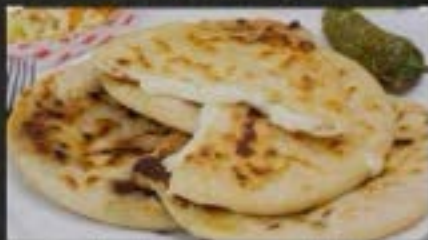
PUPUSAS $5 EACH