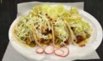
CAMPECHANOS $5 EACH