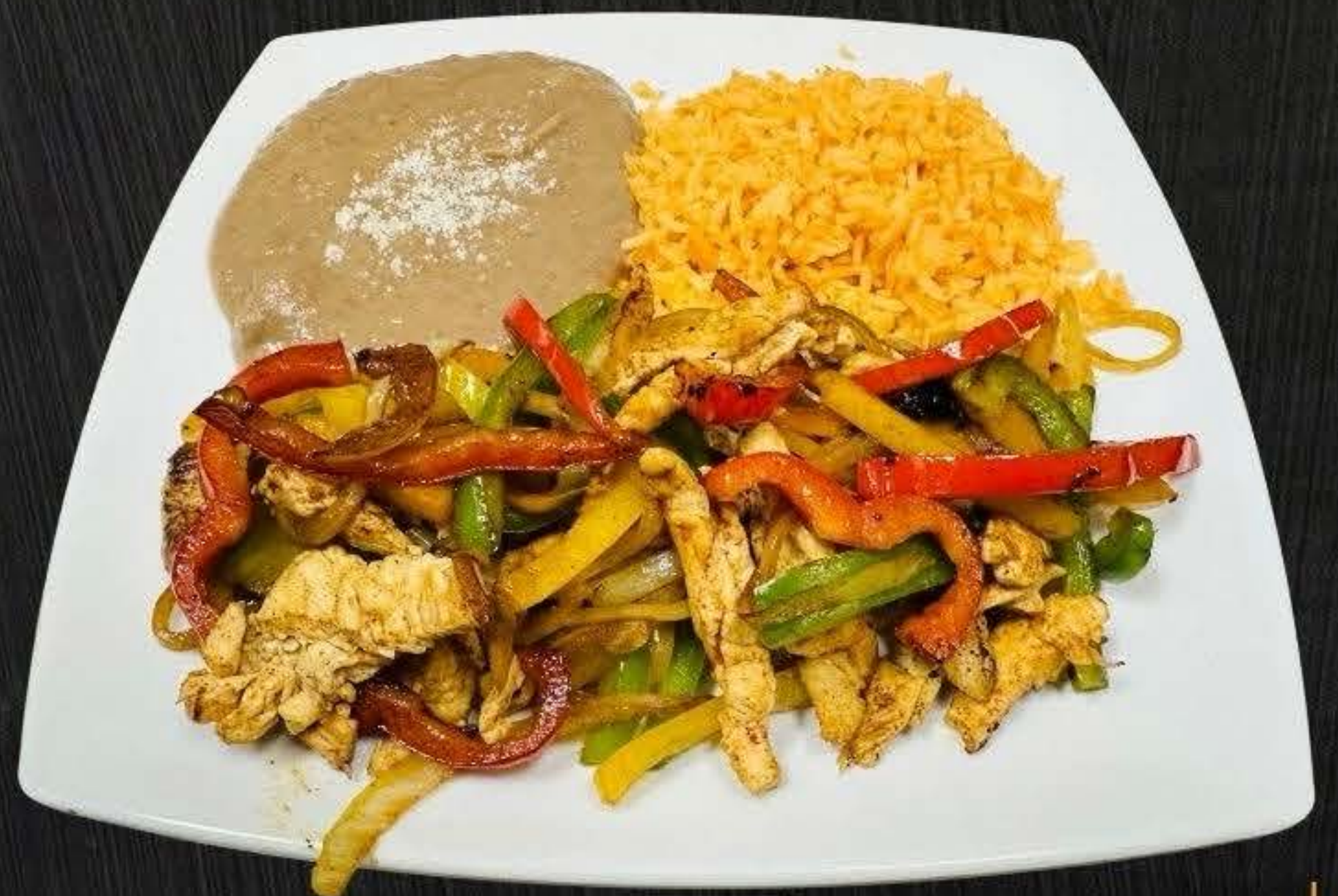
CHICKEN FAJITAS $18.50