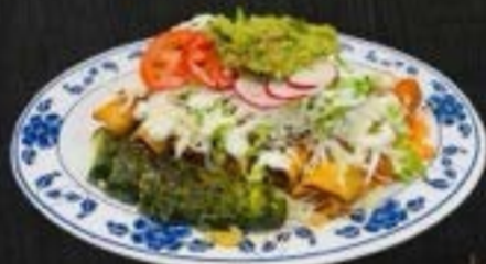
TACOS BORRADOS $10