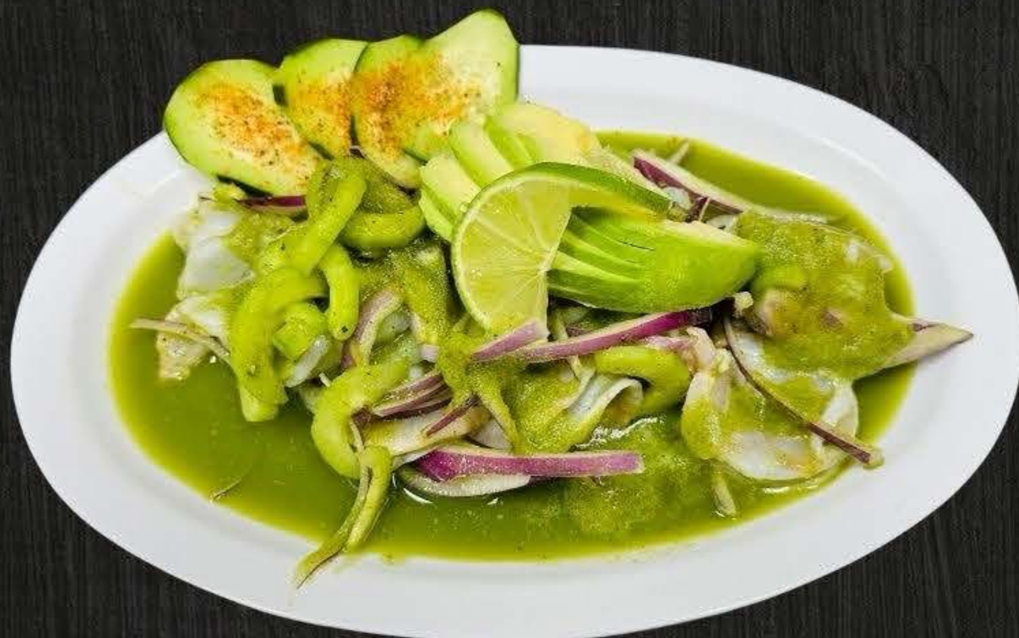
AGUACHILE VERDE $18.50