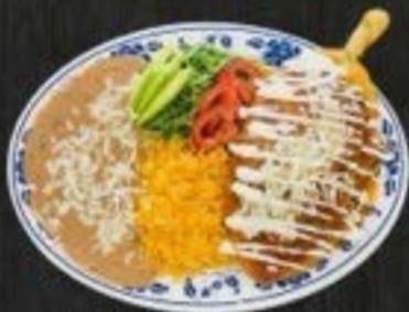
CHILES RELLENOS $13.50 roasted poblano peppers stuffed with cheese