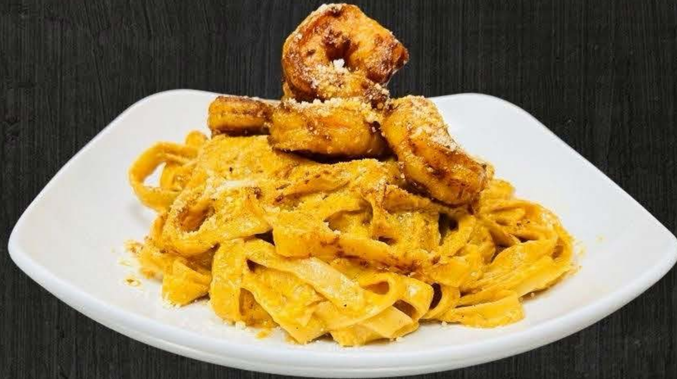
PASTA CON CAMARON $19