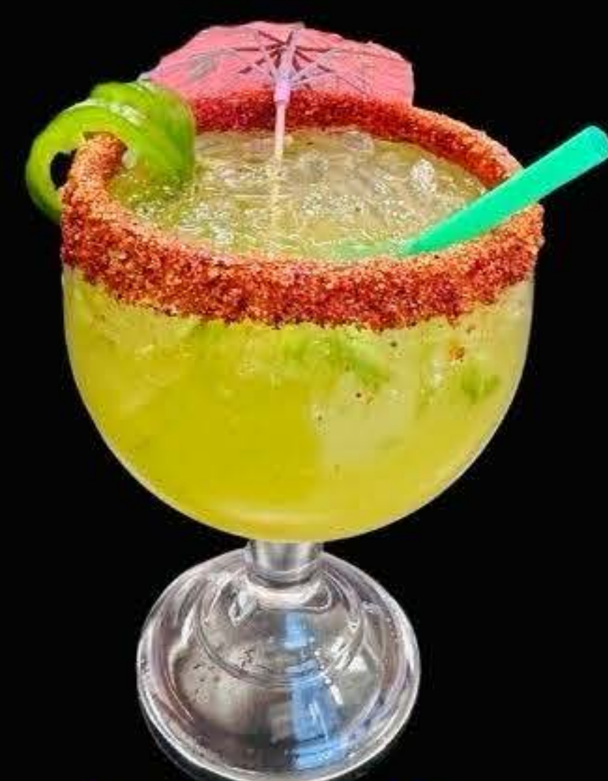
jalapeño margarita $14