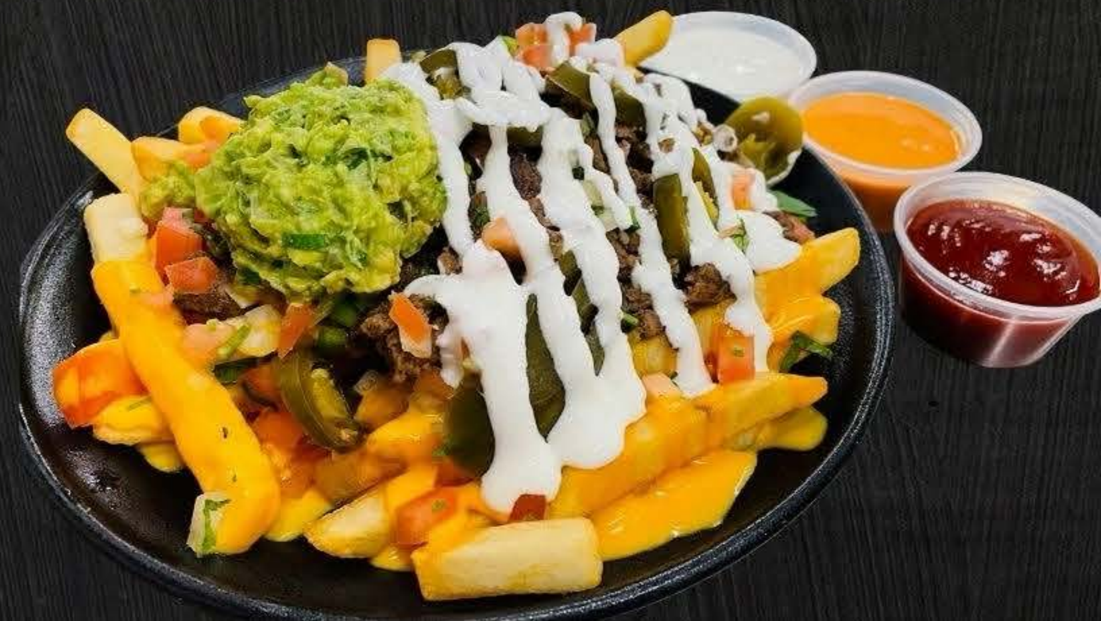
ASADA FRIES $14