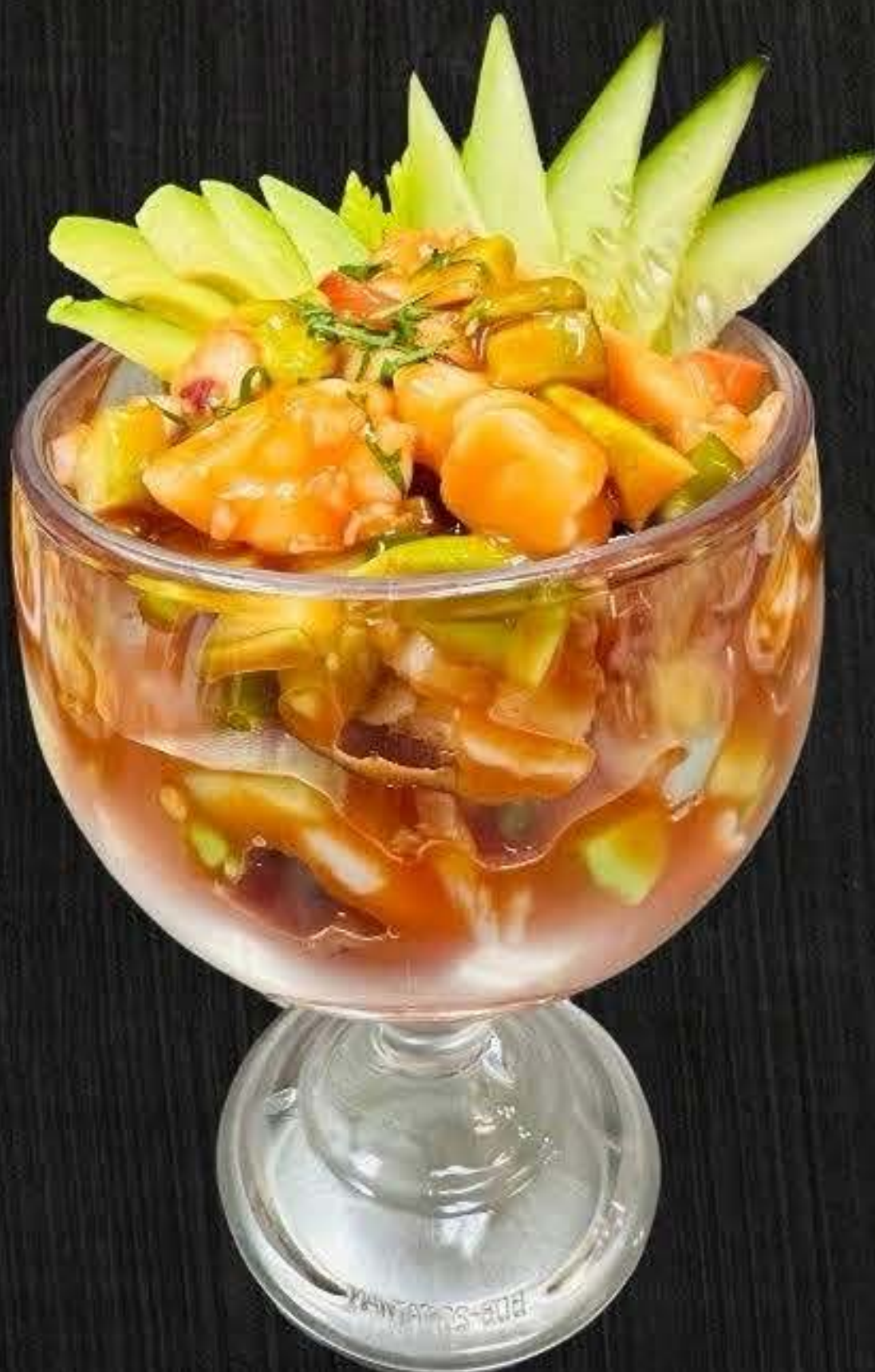
COCTEL DE CAMARON $18