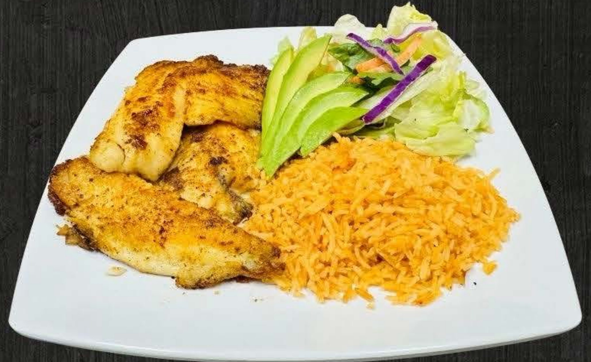
FILETE DE PESCADO $12.50