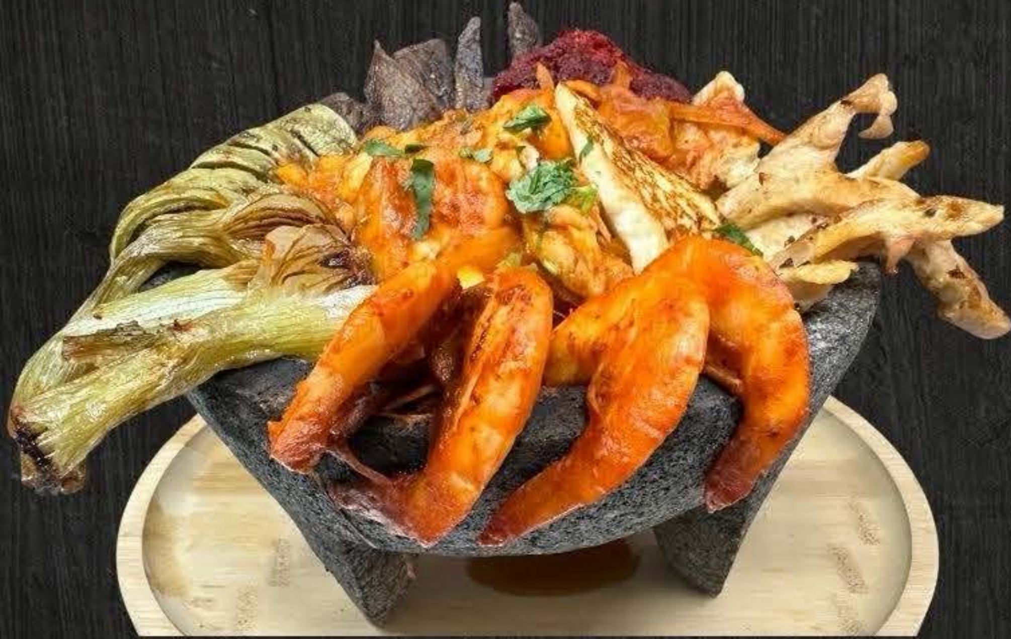
MOLCAJETE MAR Y TIERRA $35 MOLCAJETE REGULAR $30