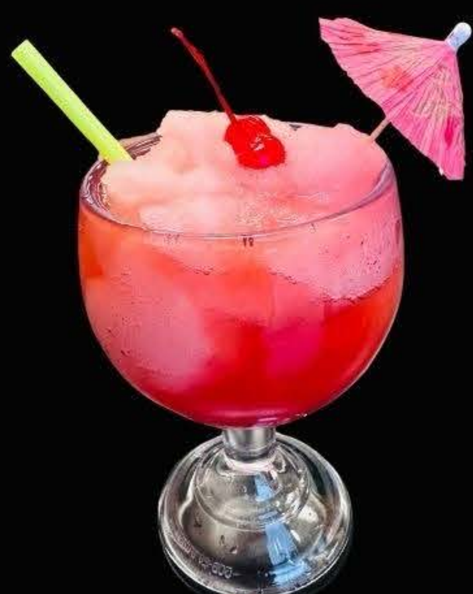
strawberry margarita $16