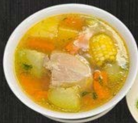
SINCRONIZADA $6 EACH