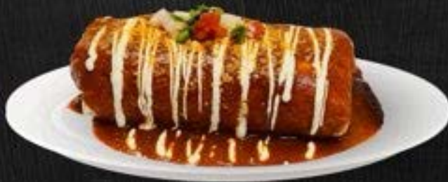
WET BURRITO $14