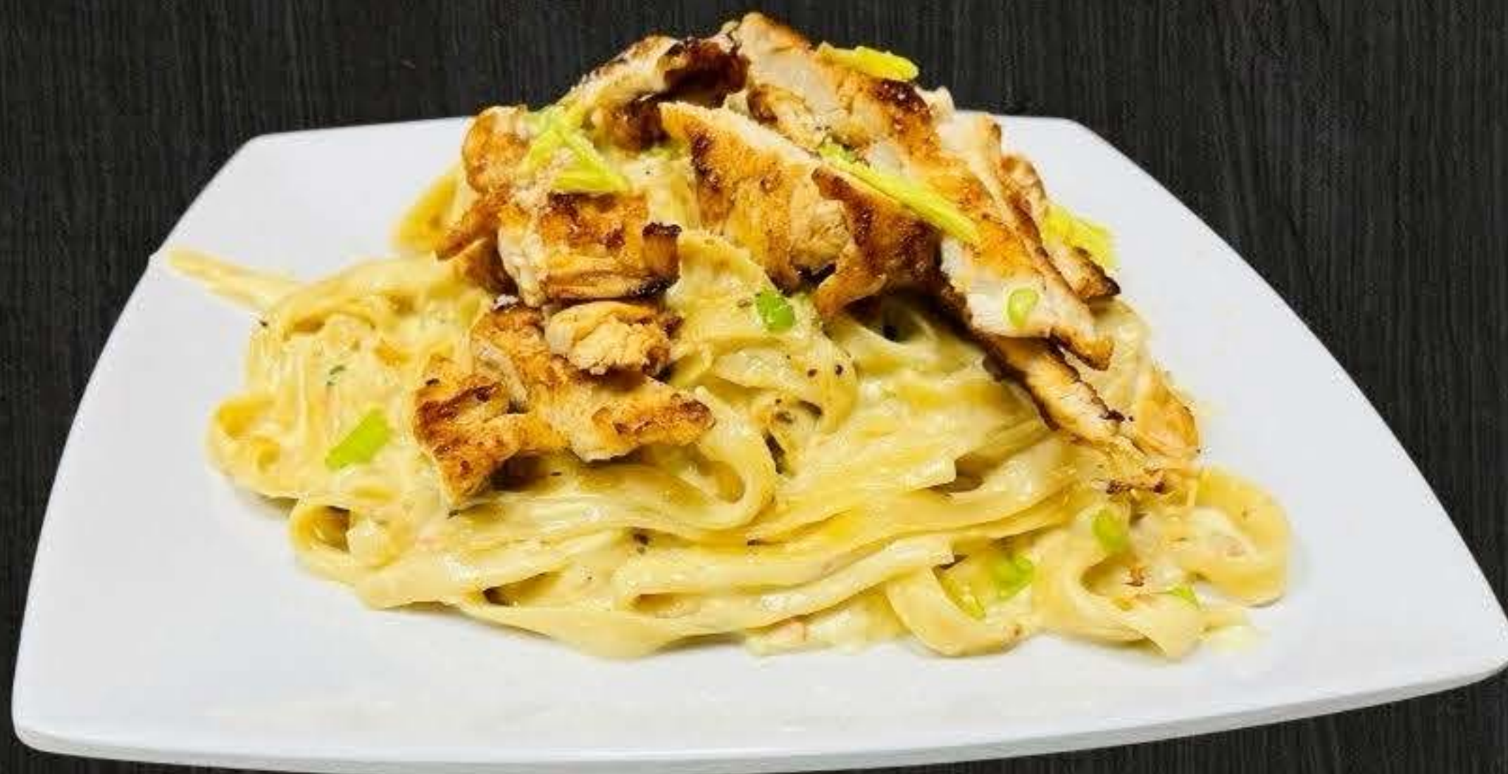
FETUCHINI ALFREDO $18.50