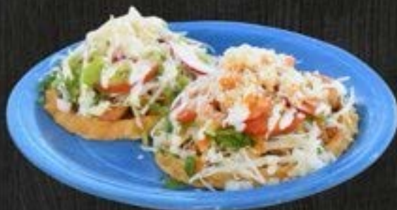
SOPES $7 EACH

rice, beans, lettuce, cilantro, onion, tomato, meat, sour cream, and cheese