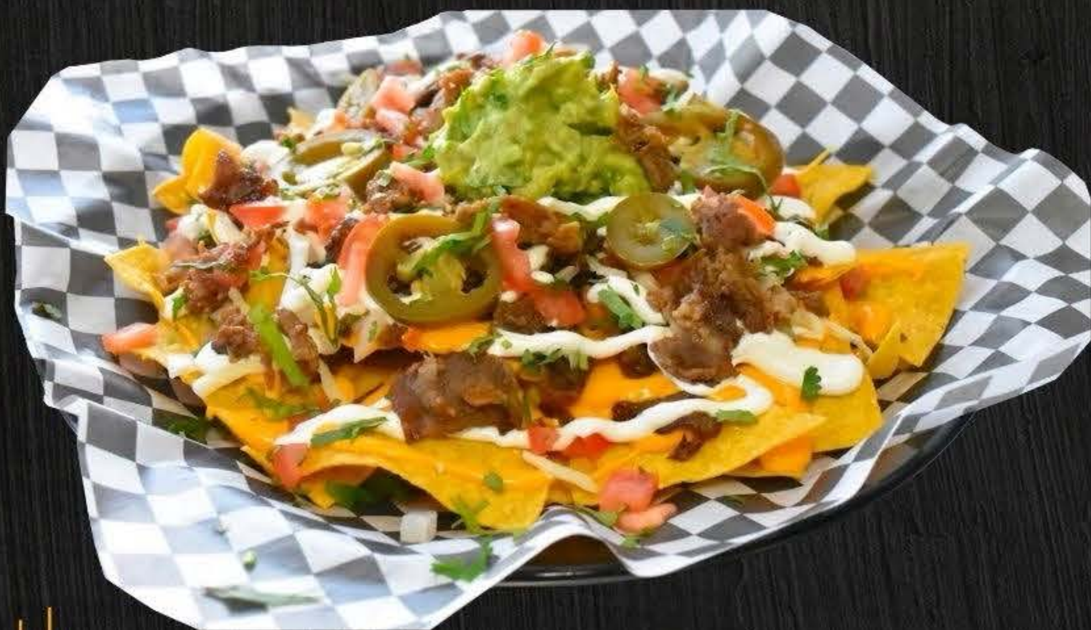
SUPER NACHOS $13