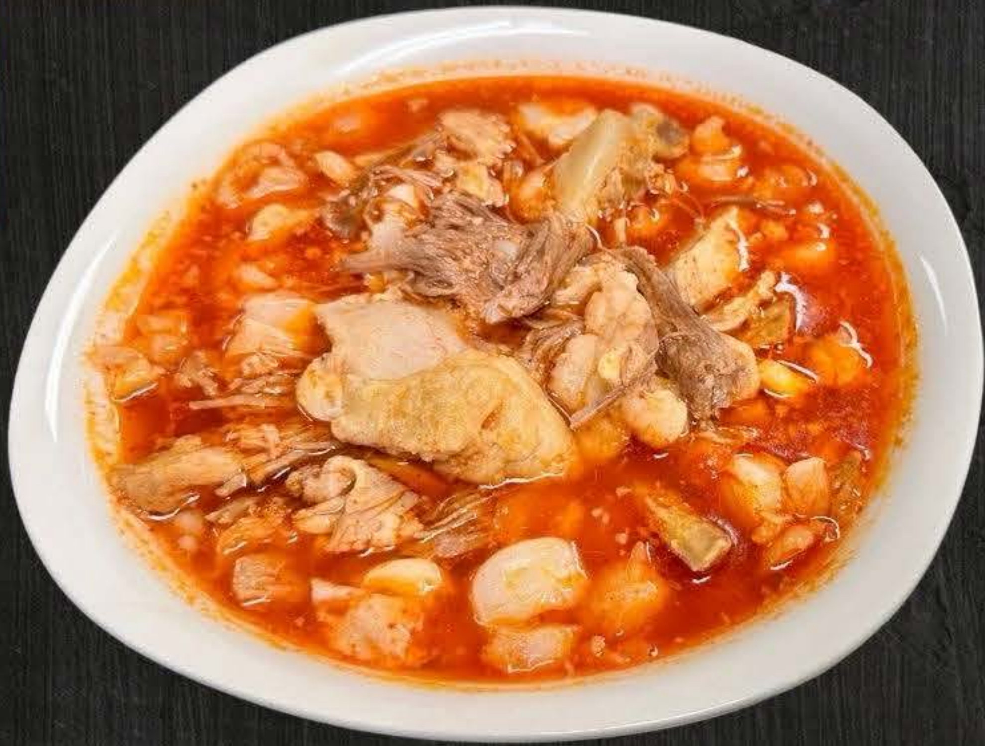
POZOLE ROJO $16

brothy soup made with pork, hominy, and red chiles.