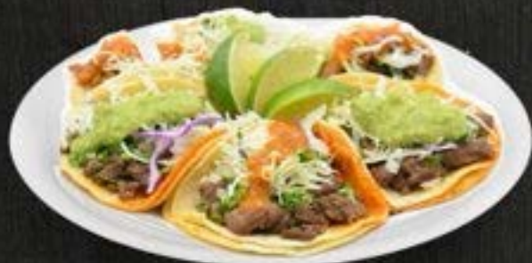
REGULAR TACOS $3.50

GRILLED STEAK - PASTOR (MARINATED PORK W/ PINEAPPLE) - BEEF TONGUE - CHICKEN - BIRRIA (SAVORY MEXICAN BEEF STEW)