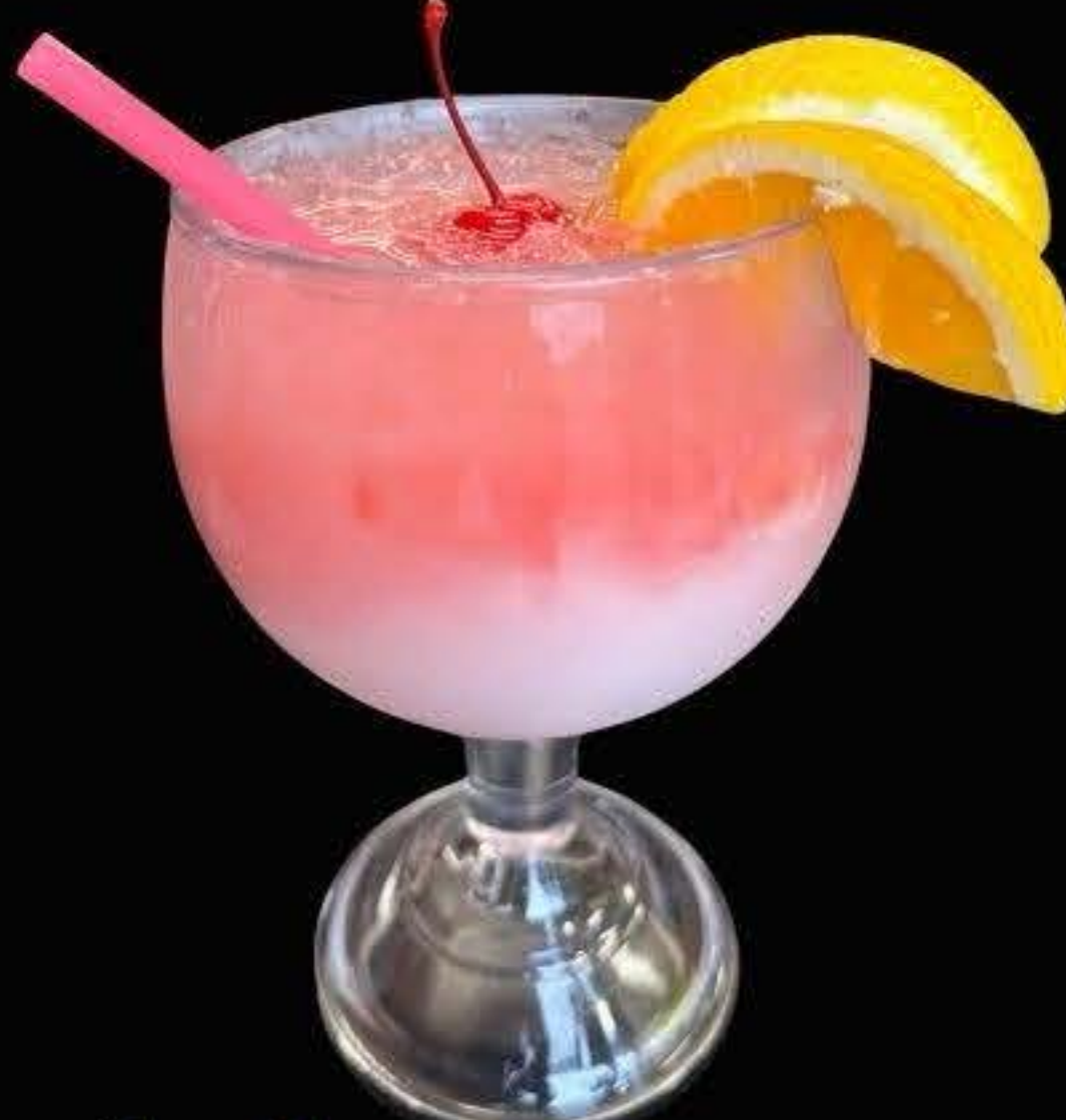
bahama mama $14