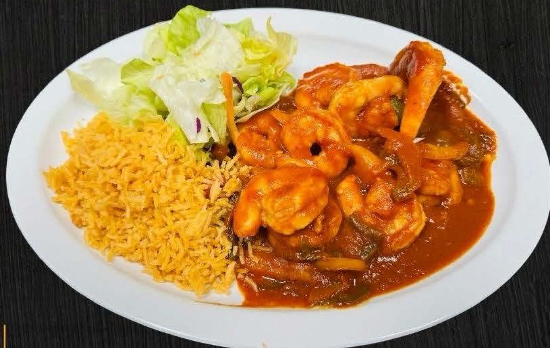
CAMARON A LA DIABLA $19.50