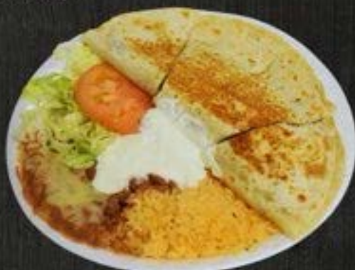
QUESADILLA PLATE $12.50

thick corn tortilla, stuffed with cheese, meat, and veggies