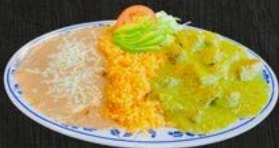
COSTILLAS DE PUERCO EN SALSA $16