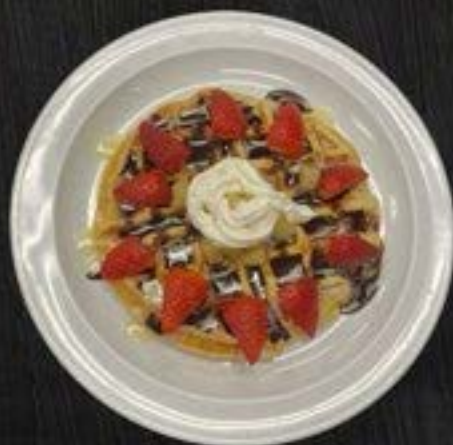
HOMEMADE WAFFLE 98