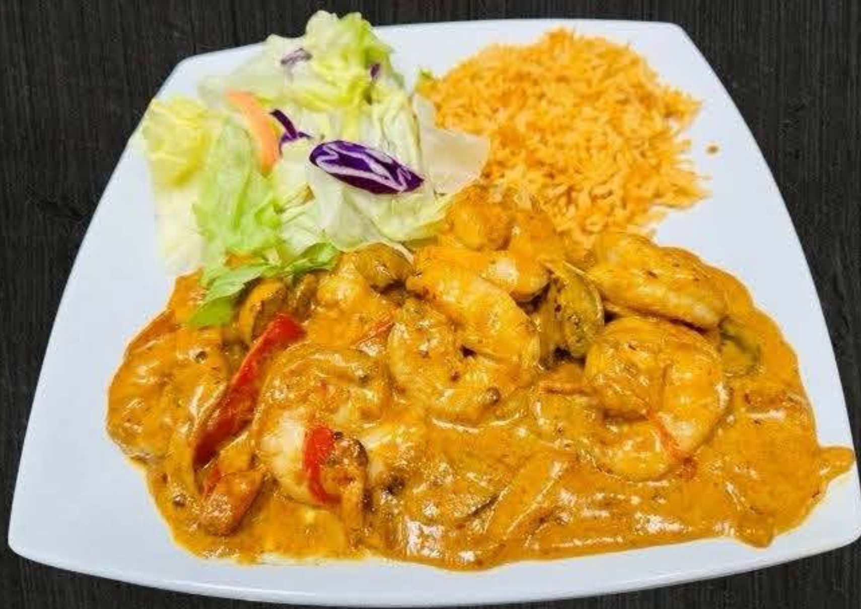
CAMARONES A LA CREMA CON CHIPOTLE $19.50