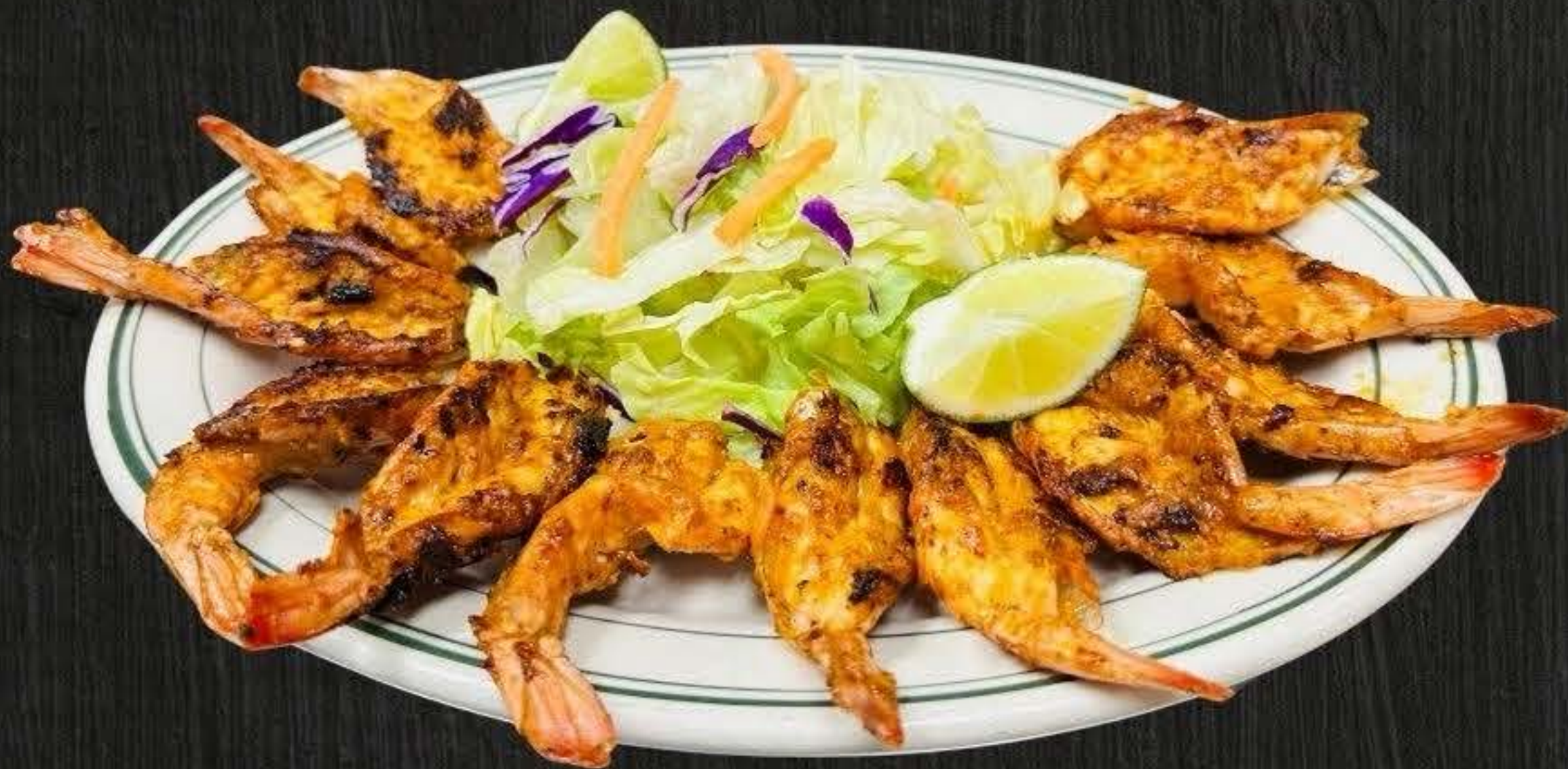
CAMARONES SARANDEADOS $20